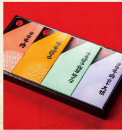
佃煮詰合せ (NT-C) 4,320円(税込)

内容: 薄切牛肉 牛そぼろ 牛そぼろ・椎茸・竹の子 薄切牛肉・帆立 薄切牛肉・割干大根 薄切牛肉・舞茸・竹の子 アレルギー表示: 小麦・牛肉・大豆・さば