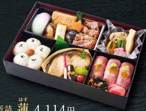
はす 折詰 蓮 4,114円

折詰メニューはお供え専用とさせていただきます お供えは皆様と同じお料理でもご用意できます