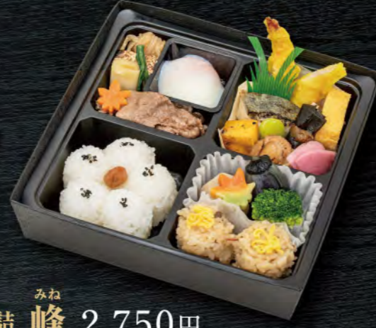
みね 折詰 峰 2,750円

黒毛和牛すき焼・奥久慈卵温泉玉子・銀鱈西京焼 口取り・煮物・ローストビーフ握り・白飯・すき焼タレ