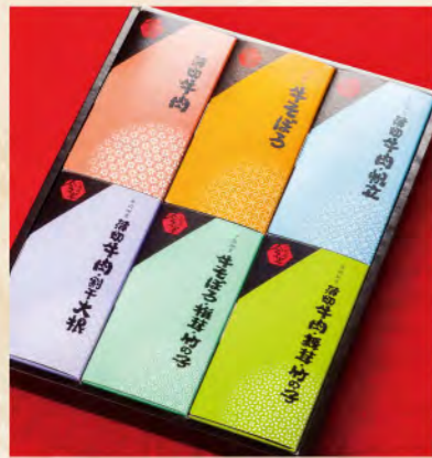
佃煮詰合せ (NT-D) 6,264円(税込)

内容: 薄切牛肉 牛そぼろ 牛そぼろ・椎茸・竹の子 薄切牛肉・帆立 薄切牛肉・割干大根 薄切牛肉・舞茸・竹の子 アレルギー表示: 小麦・牛肉・大豆・さば